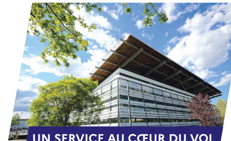
UN SERVICE AU CŒUR DU VOL

À Orly, après l'installation du nouveau radar SOL de nouvelle génération au-dessus de la Tour de contrôle, les agents IESSA de la Direction Technique et de l'Innovation (DTI) et du service Technique de l'organisme ont procédé au calibrage du système avant de le déclarer bon pour les opérations.