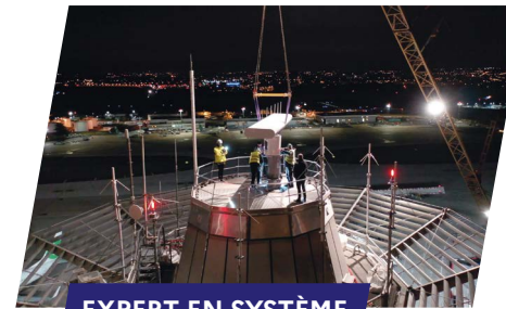
EXPERT EN SYSTÈME DE SURVEILLANCE

À Orly, après l'installation du nouveau radar SOL de nouvelle génération au-dessus de la Tour de contrôle, les agents IESSA de la Direction Technique et de l'Innovation (DTI) et du service Technique de l'organisme ont procédé au calibrage du système avant de le déclarer bon pour les opérations.