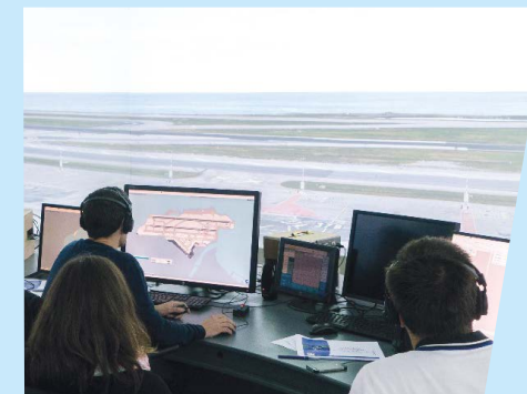
Participation à un projet européen d'innovation (DTI).

À la direction de la Technique et de l'Innovation (DTI) à Toulouse , vous travaillez à la définition et au design des systèmes de la sécurité aérienne en lien direct avec les industriels du secteur et la direction des Opérations de la DSNA. Vous assurez aussi leur déploiement au niveau national. Vous garantes ainsi la performance de l'infrastructure technique nécessaire à la navigation aérienne.