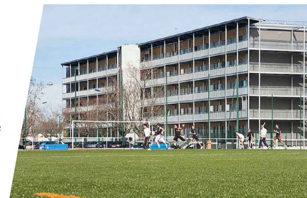
Des résidences étudiantes conviviales faisant partie intégrante du campus.